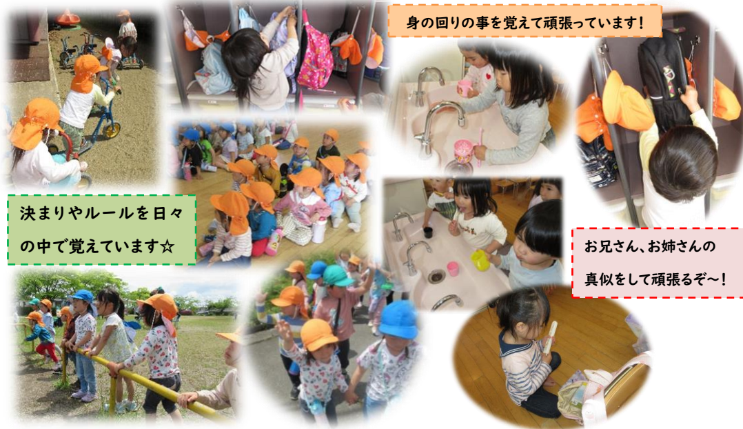
身の回りの事を覚えて頑張っています！

集団での生活や遊びの中で、繰り返しルールを知らせてきました。決まりや約束がある事を少しずつ理解し、守ろうとする姿が多く見られました。今後も繰り返し、決まりやルールを守る事の大切さを伝え、友達と一緒に生活する楽しさを味わえるようにしていきたいと思います。