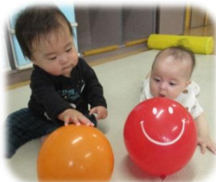
砂場で砂の感触に喜んでいました！